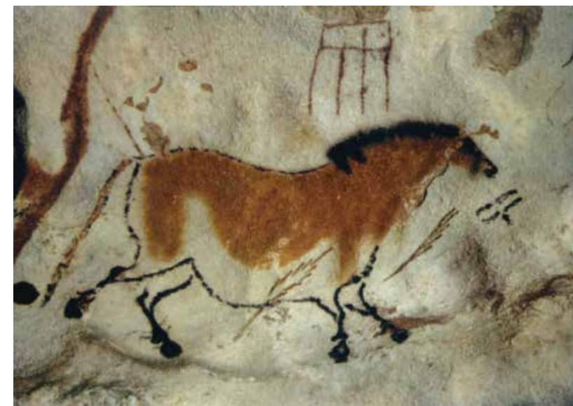
ラスコー洞窟壁画 (南フランス・2万～1万5000年前)